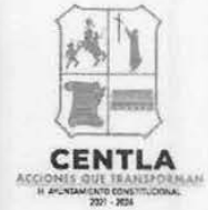
MATRIZ DE INDICADORES PARA RESULTADOS